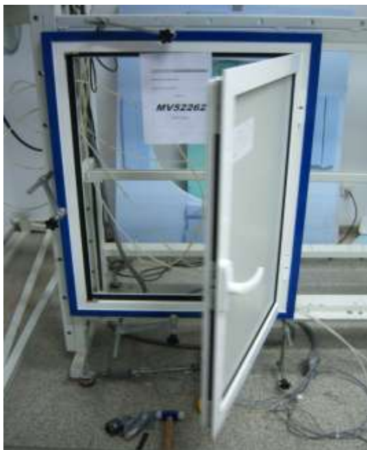
Muestra en proceso de apertura