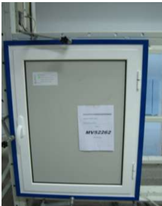
Muestra en proceso de cierre